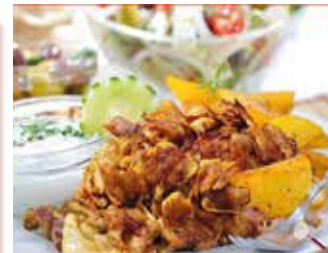
CARNE DE KEBAB DE POLLO ASADO