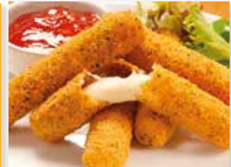
TRIANGULO CHEDDAR EMPANADO