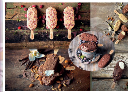
HELADOS Página 28