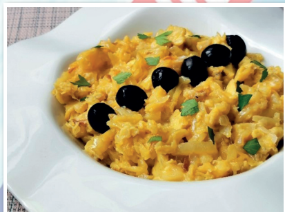
SIN GLUTEN Página 16