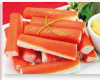
PALITOS DE CANGREJO