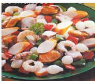
SALPICÓN DE MARISCOS