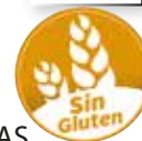
NUII ALMENDRAS SALADAS CARAMELIZADAS CON MIEL