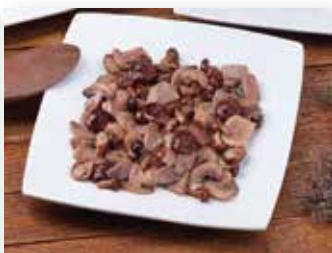
SALTEADO DE ALCACHOFAS