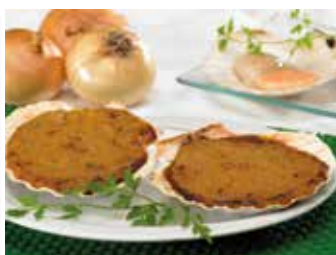
VIEIRA DE LANGOSTINOS UND.