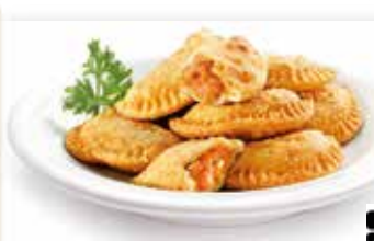
EMPANADILLA DE BONITO