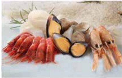
PREPARADO DE PAELLA