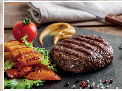
CARNES Página 21