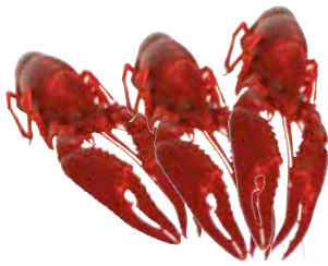
CANGREJO DE RIO COCIDO