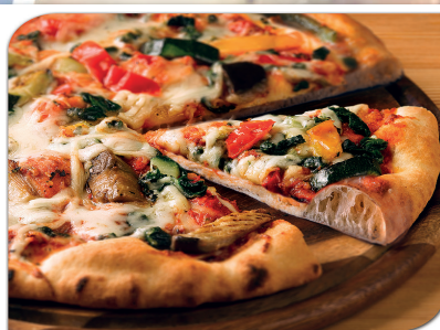
PIZZAS Página 27