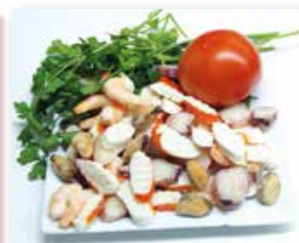
CÓCKTEL DE MARISCOS