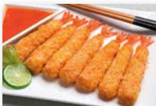
TORPEDO LANGOSTINO 880G.