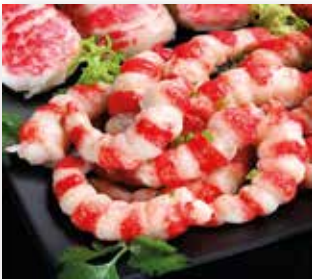
SIRENAS DE MAR