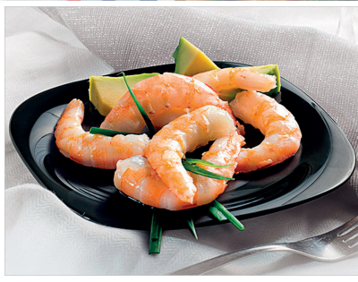
MARISCOS Página 8