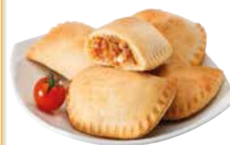
EMPANADILLA DE CARNE