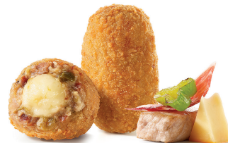
PRECOCINADOS Página 10