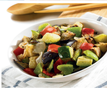
VERDURAS Página 17