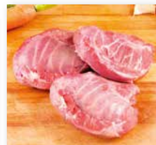
CARRILLADA DE CERDO