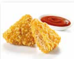
NACHOS DE POLLO TIJUANA