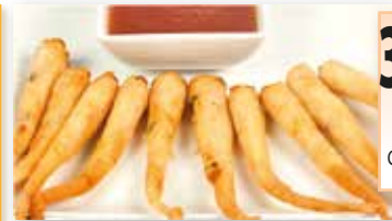
MINI TWISTER LANGOSTINO