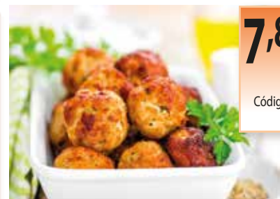
ALBONDIGAS MIXTAS PREFRITAS