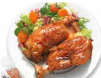
CODILLO DE CERDO ASADO