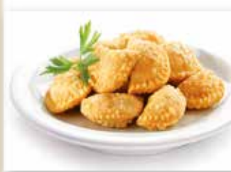
MINIEMPANADILLA DE ATÚN