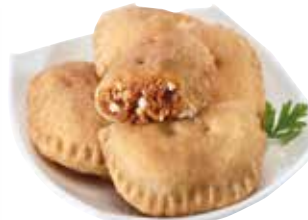
EMPANADILLA DE PIZZA