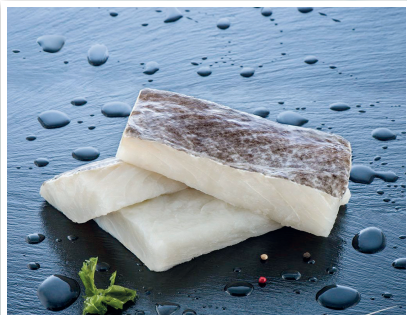
PESCADOS Página 3