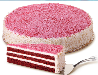
BOLLERIA, PASTELERÍA Y PAN Página 23