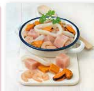
FRUTO DE MAR