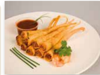
TWISTER DE LANGOSTINOS

COCIDO - VERDURAS CON QUESO DE CABRA - DE SETAS ATÚN Y PIQUILLO - CHIPIRÓN EN SU TINTA - BACALAO - POLLO - CHIPIRÓN