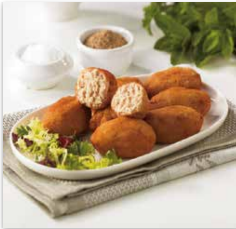
CROQUETAS MESÓN 500 GR