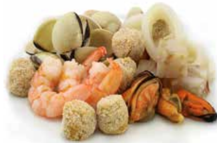
SOPA GOURMET MARISCO