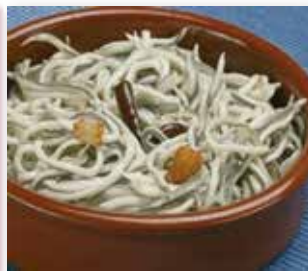
SUCEDANEO DE ANGULAS