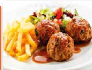
ALBONDIGAS DE POLLO